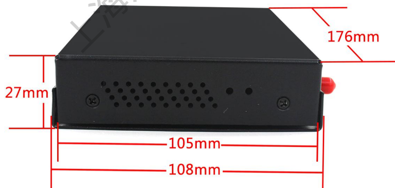
( L10侧面图 )