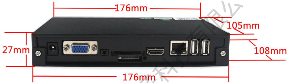
( L10背面图 )